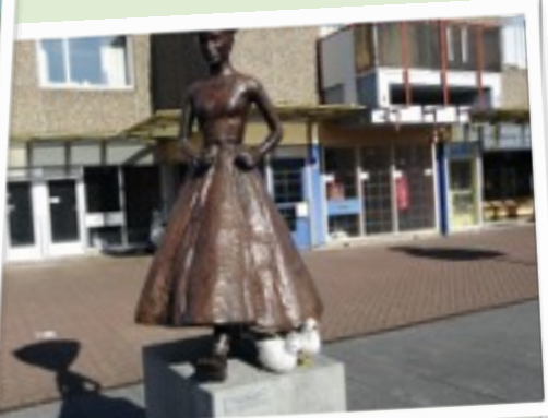
Drechtze houdt haar blinddoek nog even op!