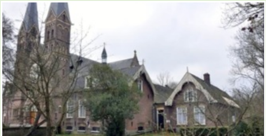
Antoniushoeve, nu nog in zwaar verval.