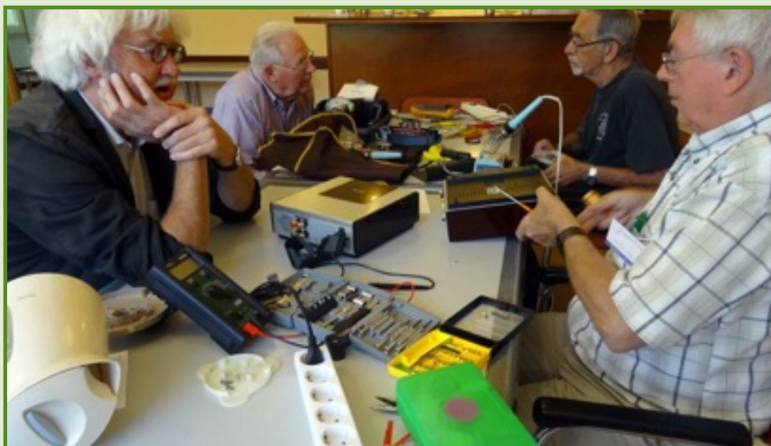
Repair cafe vrijwilligers volop aan het werk