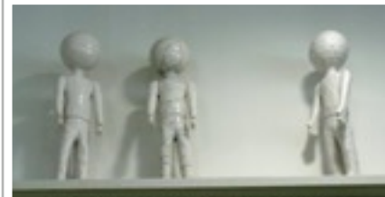
bakkie, doeve en drekkie

en middelvinger maakt zij het pingping gebaar.