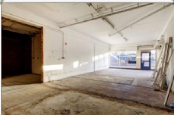
Leegstand winkelvastgoed richting grens 10% Aandeel leegstand in totale winkelvloeroppervlakt