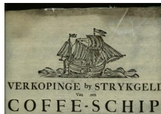
Verkoping van een kofschip in Workum, 1801.