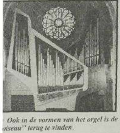
Ook in de vormen van het orgel is de „oiseau” terug te vinden.

Hermsdorf — De Hervormde gemeente van Krabbendijke heeft regelmatig contact met een zustergemeente in Hermsdorf (Oost-Vlaanderen). Als resultaat daarvan rengt het Dresdner Vokalisten zangwiel binnenkort een bezoek aan ons land. Op 22 maart wordt in de Hervormde kerk te Krabbendijke een concert gegeven in samenwerking met het Zeeuws mannenkoor. Verdere gelegenheden om de Dresdner Vokalisten te horen zijn: 21 maart Oud eijerland, 23 maart Voorburg, 24 maart Ede, 27 maart Leiden, 29 maart Haarlem, 30 maart Leiderdorp en 31 maart Linschoten.