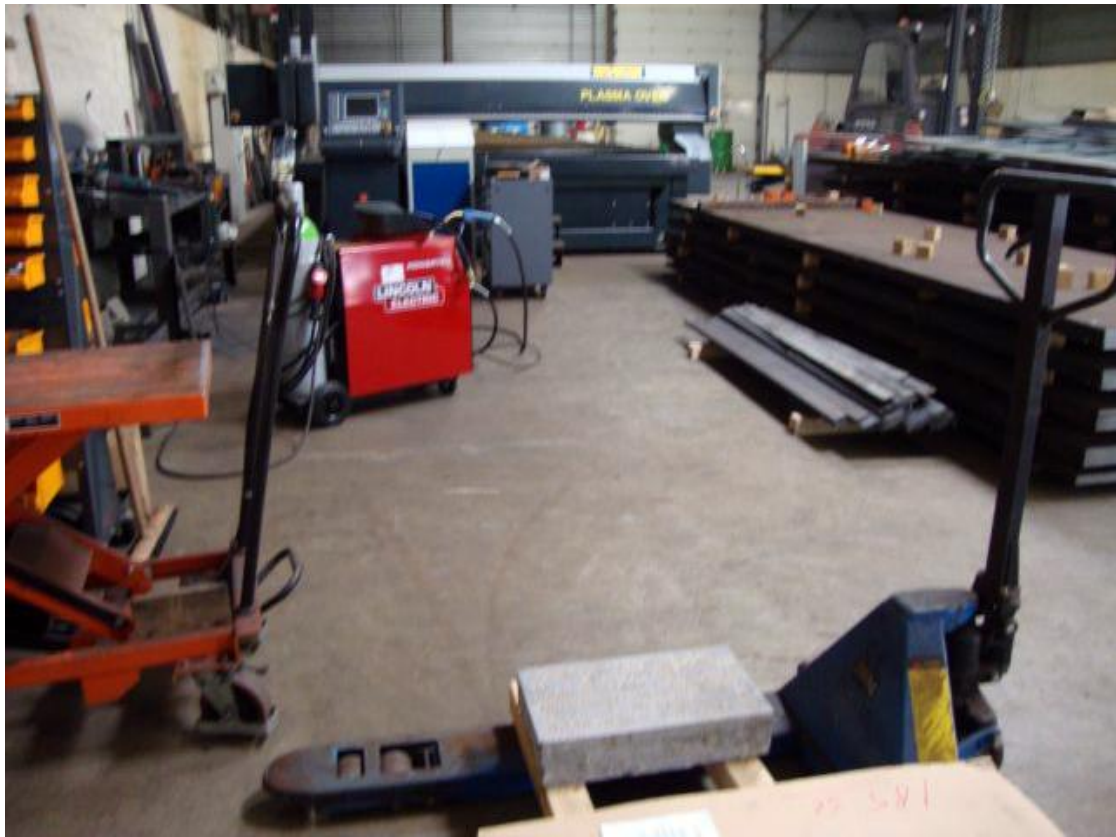
In de werkplaats