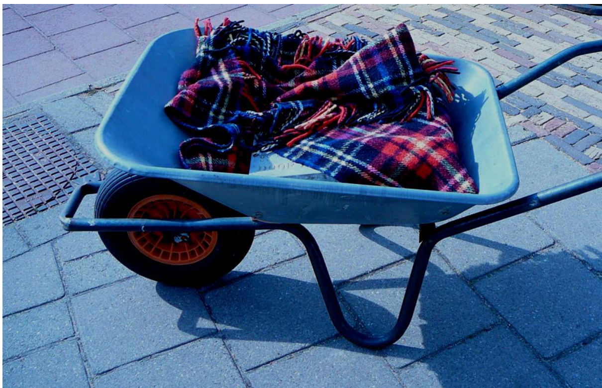
En zo gaat de steen op reis naar Geleen