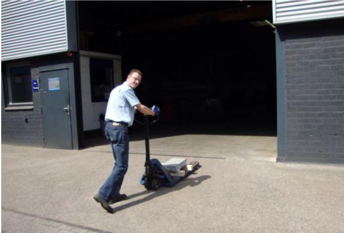
Metaal Service Dassen - Geleen