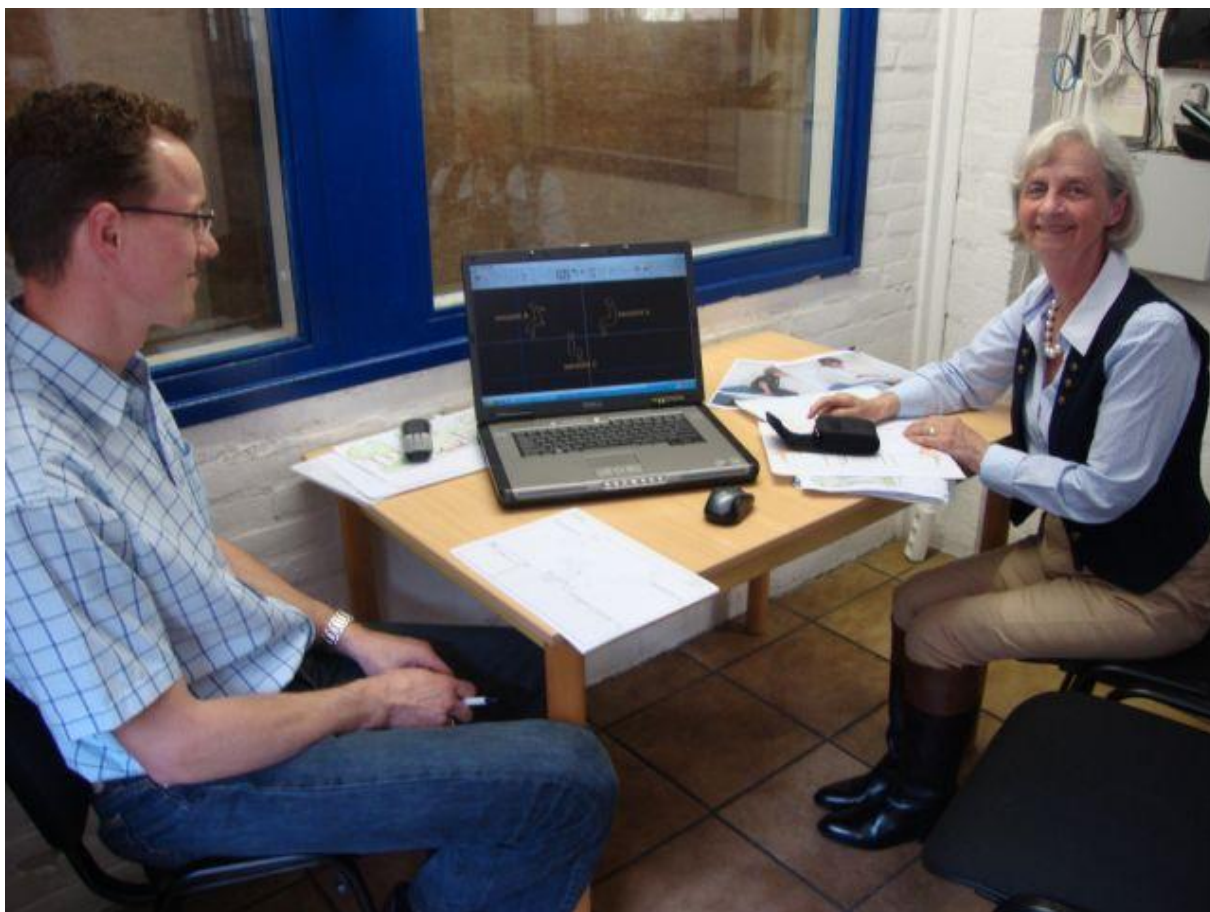
Geleen 13 mei 2011 Digitalisering van het ontwerp.